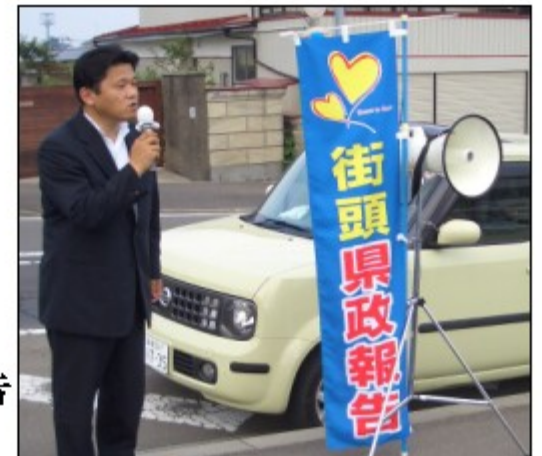
街頭から→ 県政報告