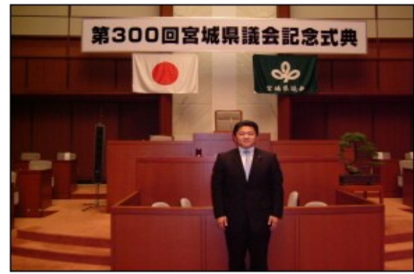
第300回の記念すべき宮城県議会