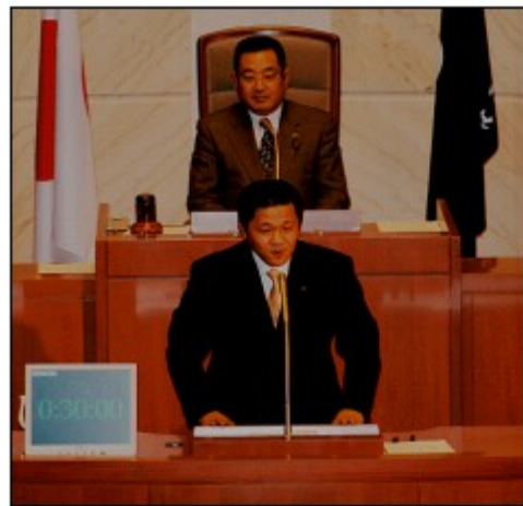
議会にて一般質問