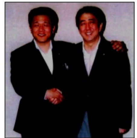
安倍首相（当時官房長官）