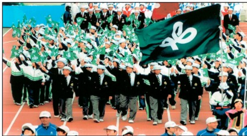
←岡山国体へ 議会代表として （中央正面）