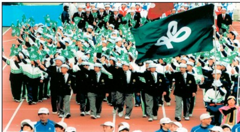
←岡山国体へ 議会代表として （中央正面）