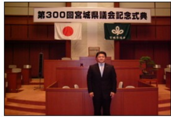
第300回の記念すべき宮城県議会